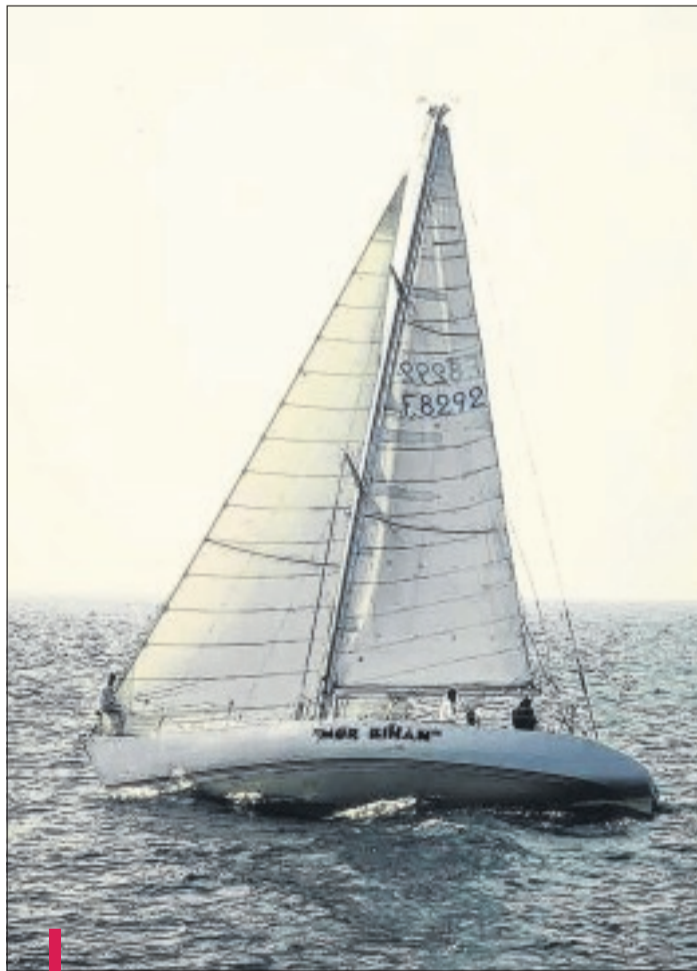
Construit à Etel (56) à la fin des années 70 par trois jeunes passionnés de voile mais sans le sou, le Mor Bihan a été financé grâce à une souscription auprès des Bretons.